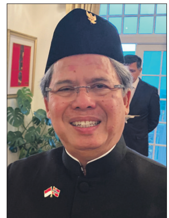
FORFATTER: Ambassadør dr. Todung Mulya Lubis har gitt ut boken «Political Corruption in Indonesia».

– Hvis islamofobien får lov å fortsette, vil det skape reaksjoner i andre land. Vi er alle enige i demokratiet. Men demokratiet bør også bæres av den kollektive vilje til å bringe mennesker og religioner til å leve sammen på en fredfull måte som kan opprettholdes.